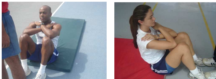
Figura 3 – Flexão de tronco sobre as coxas para os sexos masculino e feminino

Neste exercício serão exigidos os mesmos padrões de execução para ambos os sexos.