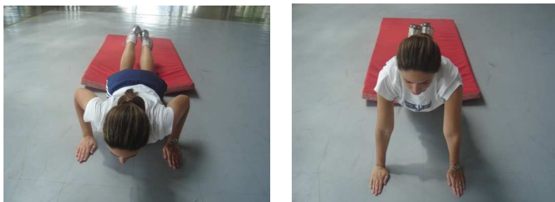
Figura 2 – Flexão e extensão dos membros superiores com apoio de frente sobre o solo para o sexo feminino.