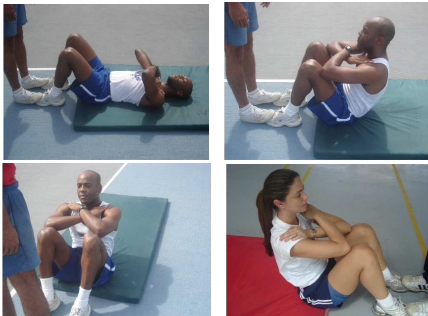
Figura 3 – Flexão de tronco sobre as coxas para os sexos masculino e feminino Neste exercício serão exigidos os mesmos padrões de execução para ambos os sexos.

Será avaliada através da flexão do tronco sobre as coxas.