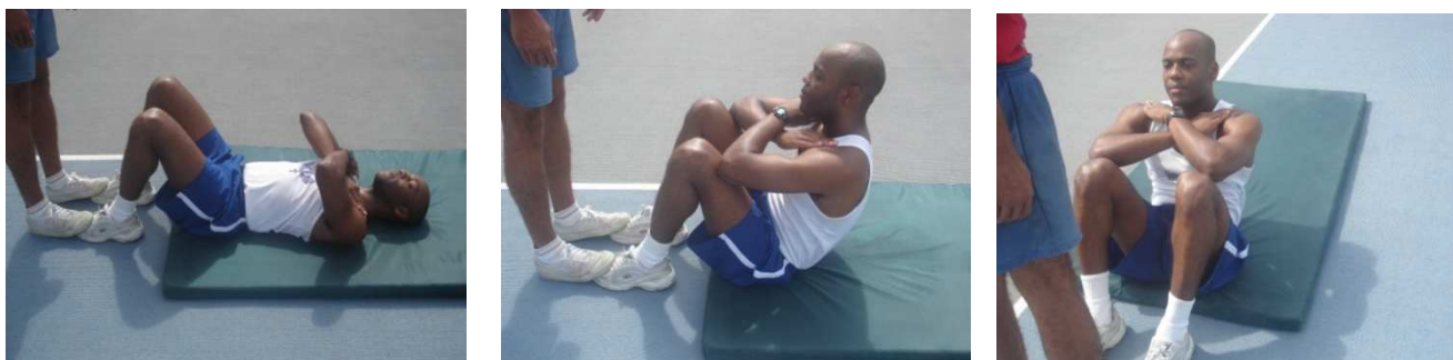
Figura 3 – Flexão de tronco sobre as coxas

Será avaliada através da flexão do tronco sobre as coxas.