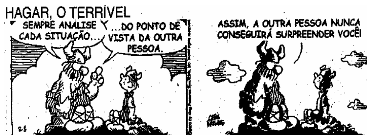
BROWNE, Chris. Hagar, o terrível. A Tarde , Salvador, 9 abr. 2006. Caderno 2, p. 8. Passatempos.