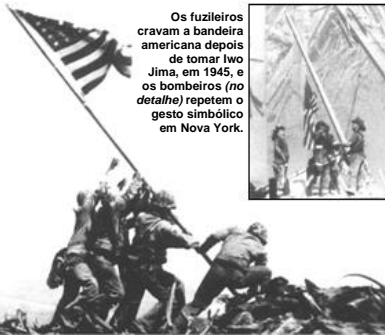
Os fuzileiros cravam a bandeira americana depois de tomar Iwo Jima, em 1945, e os bombeiros (no detalhe) repetem o gesto simbólico em Nova York.

O que realmente incomoda a ponto da exasperação os fundamentalistas, apontados como os principais suspeitos de autoria dos atentados, não é só a arrogância americana ou seu apoio ao Estado de Israel. O que os radicais não toleram, mais que tudo, é a modernidade. É a existência de uma sociedade em que os justos podem viver sem ser incomodados e os pobres têm possibilidades reais de atingir a prosperidade com o fruto de seu trabalho. Esse é o verdadeiro anátema dos terroristas que atacaram os Estados Unidos. Eles são enviados da morte, da elite teocrática, medieval, tirânica que exerce o poder absoluto em seus feudos. Para eles, a democracia é satânica. Por isso tem de ser combatida e destruída.