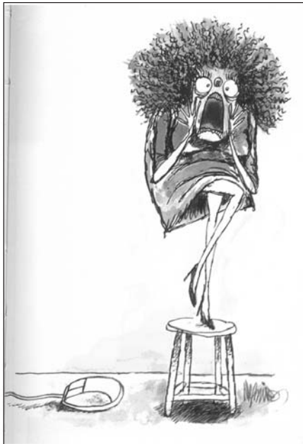
NEGREIROS apud DIMENSTEIN, Gilberto. Aprendiz do futuro , SP: Ática, p.11.

“Os instrumentos de comunicação se multiplicam, mas o potencial de captação do homem — do ponto de vista físico, mental e psicológico — continua restrito. Então, diante do bombardeio crescente de informações, a reação de muitos tende a tornar-se doentia: ficam estressados, perturbam-se e perdem a eficiência no trabalho.”