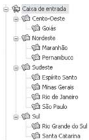
Esquema 2: Localizar: