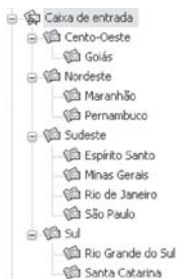
Esquema 2: Localizar: