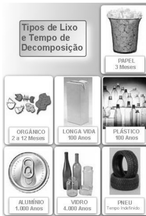
Imagem I, para responder às questões 6 e 7.

Internet: < http://www.casaideal.wordpress.com/reduza-reutilize-recicle/ >. Acesso em 3/1/2010.