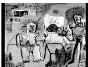
Arroz com Polo