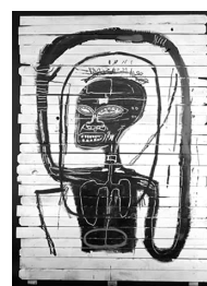
Basquiat flexible 1984

Um(a) arte-educador(a), ao propor uma atividade, organiza as seguintes atividades em artes visuais: