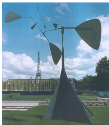
Alexandre Calder - A espiral

Essas duas imagens nos mostram duas obras de arte colocadas em lugares públicos, são elas: