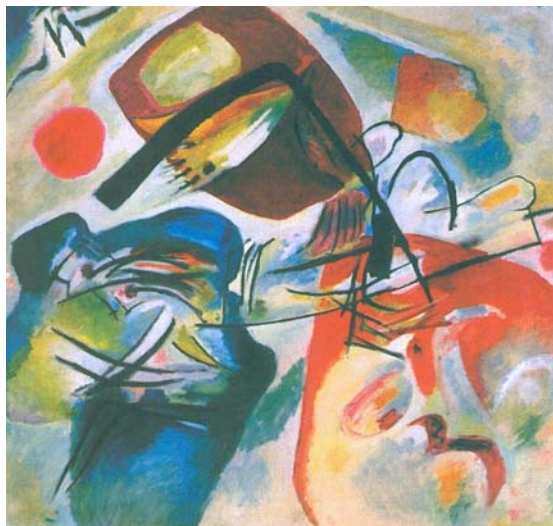
Com o arco negro Wassily Kandinsky, 1912

No início do século XX apareceram diversos movimentos artísticos em que se dispensava a representação de objetos e de temas da natureza, de maneira clara. A renúncia à figura era o caminho necessário para alcançar uma pintura pura. Wassily Kandinsky, foi o pioneiro desse movimento, que tem nomes como Piet Mondrian, Malevitch entre seus primeiros representantes. Observe a reprodução da obra que representa muito bem este estilo de pintura e assinale a resposta correta .