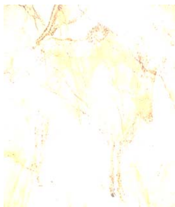
Bisonte: grutas de Lascaux