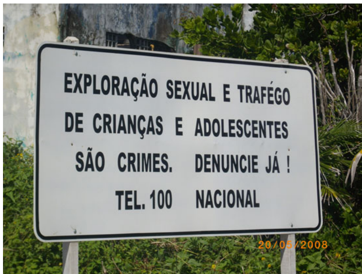
Imagem disponível em: noticias.bol.uol.com.br/.../04/ult2529u400.jhtm . Acesso em 20-04-2010.