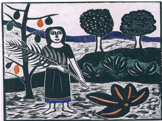
A virgem da palma – Samico

Observe a imagem da gravura e identifique a técnica utilizada, assinalando a resposta correta .