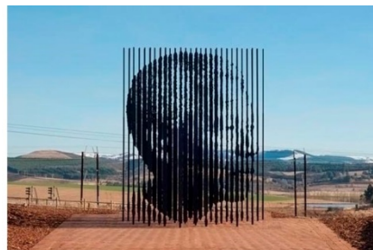
Marco Cianfanelli, Release (Soltura), 2012, África do Sul, aço pintado e cortado a laser, profundidade 20,8 m, altura 9,48 m e largura 5,19 m.

As imagens apresentam, de diversos ângulos, a escultura de Marco Cianfanelli em homenagem ao 50º aniversário da captura e prisão de Nelson Mandela, em 1962. A obra é composta por hastes de aço de altura variável, cortadas a laser e inseridas na paisagem, na província de KwaZulu-Natal, onde Mandela foi detido pelo regime do apartheid . Ao comentar a sua obra, o artista afirmou: "As 50 colunas representam os 50 anos que se passaram desde a sua captura, mas também sugerem a ideia de que muitos compõem um conjunto; referem-se à solidariedade. Indicam a ironia de que o encarceramento de Mandela o transformou em um ícone de luta, alimentando a resistência que levou o país à democracia".