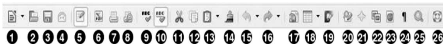
Barra de Ferramentas padrão

17. Considerando a figura abaixo do BrOffice 3.3.x Writer, língua portuguesa, marque a alternativa com a descrição do item 24.