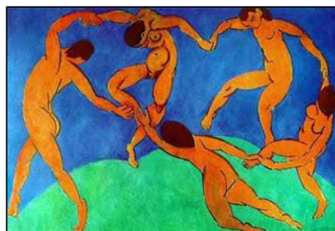
(2. A Dança, Henri Matisse, 1910.)

Em relação às obras anteriores e seus autores, é correto afirmar que