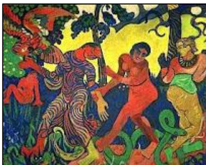
(1. A Dança, André Derain, 1905-6.)