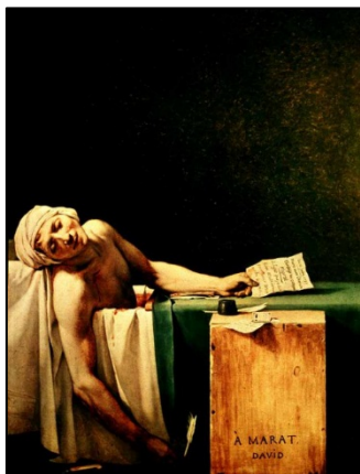
(A Morte de Marat, Jacques-Louis David.)

As imagens a seguir contextualizam as questões de 37 a 39. Analise-as.