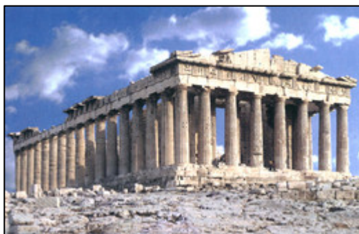
(Partenon. Disponível em: http://umolharsobrearte.blogs.sapo.pt/tag/templo+grego. )

O Partenon é um templo construído em homenagem à deusa Atena. A construção assinala o apogeu da arquitetura grega. O corpo das colunas era grosso e firmava-se diretamente no degrau mais elevado. O capitel era muito simples. A arquitrave era lisa e se apoiava diretamente nas colunas. De acordo com as características apresentadas, o Partenon foi construído no estilo arquitetônico grego denominado: