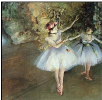
( Duas Bailarinas no Palco)

17 - O autor da obra abaixo capturou cada momento do trabalho do(a) dançarino(a) de balé, dos ensaios à apresentação. Esse pintor, desenhista, escultor e artista gráfico francês, chama-se: