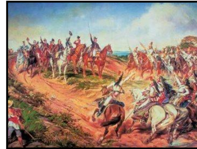
(Grito do Ipiranga)

26 - Também conhecida como “O grito do Ipiranga” e atualmente exibida no Museu do Ipiranga, em São Paulo, essa pintura ocupa uma enorme tela retangular, com mais de sete metros de largura por quatro de altura. Seu autor é o paraibano: