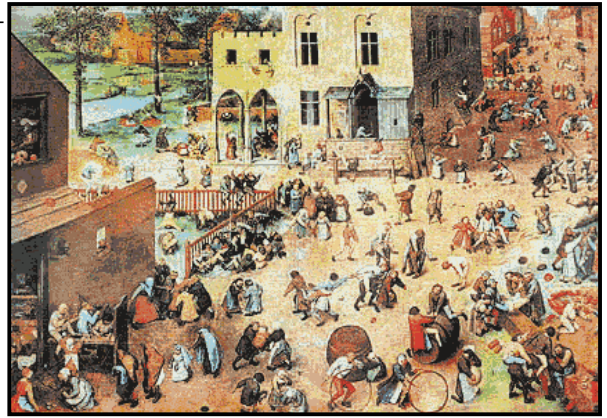
(Obra Jogos Infantis)

A obra acima, Jogos Infantis (1560) nos chama a atenção principalmente por três aspectos: primeiro, a composição com grande número de personagens. Segundo, a forte impressão de movimento. Terceiro, a atitude das crianças; elas não parecem estar brincando por prazer, mas por obrigação. Também chama a atenção a ausência de sorriso no rosto dos personagens. O autor da obra também conhecido como “o velho” (1525-1569) é: