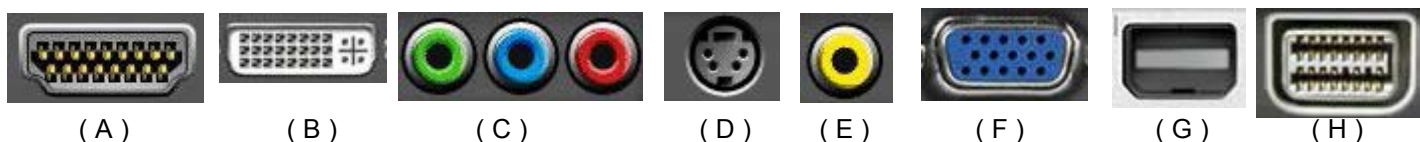
Figura 1 - Representação dos Tipos de Conectores de Vídeos

16. Assinale a alternativa que representa a identificação correta dos conectores da Figura 1.