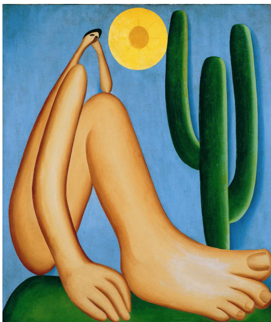
Abaporu , Tarsila do Amaral.