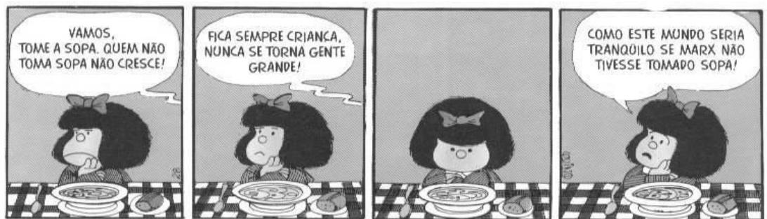
Figura disponível em: http://www.uff.br/portalmultimedia/polifonia/historiaemquadrinhos.pdf