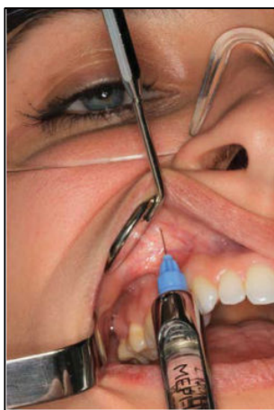
(Puricelli et al, 2014.)

Os nervos anestesiados com a técnica mostrada na figura são o