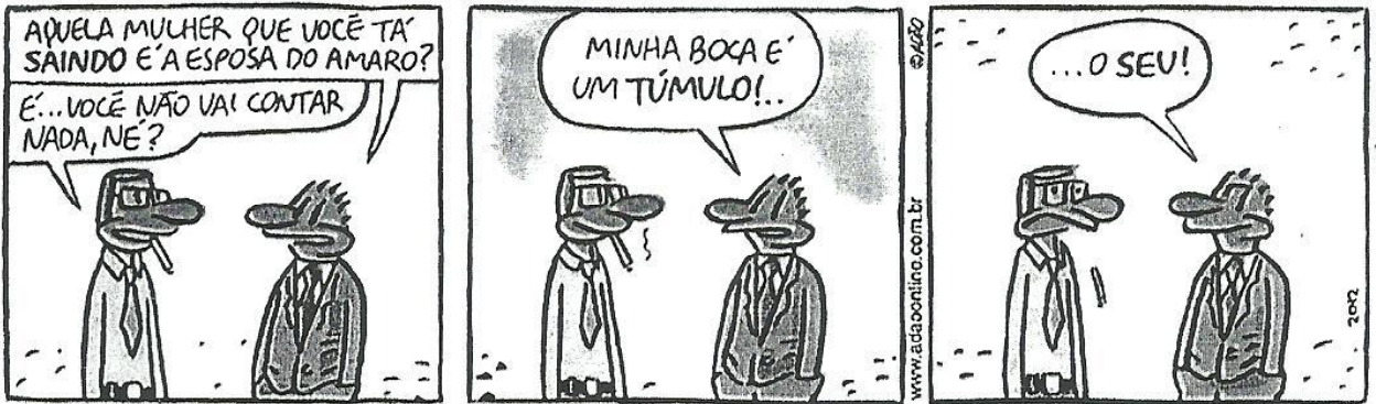
ITURRUSGARAI, Adão. La vie en rose. Folha de S. Paulo , São Paulo, 22 mar. 2003.