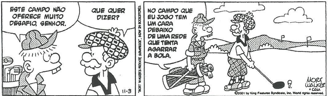
WALKER, Mort. Recruta Zero. O Estado de S. Paulo , São Paulo, 3 fev. 2002.