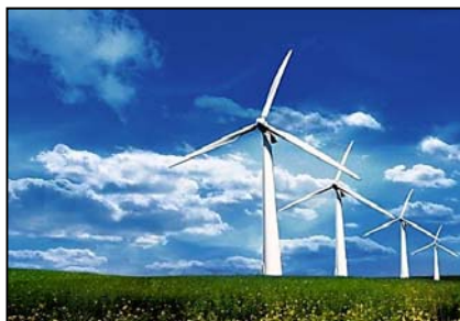
(Disponível em: http://envolverde.com.br/portal/wp-content/uploads/2014/01/energiaeolica.jpg )

As imagens são exemplos de energias alternativas que derivam do meio ambiente natural.