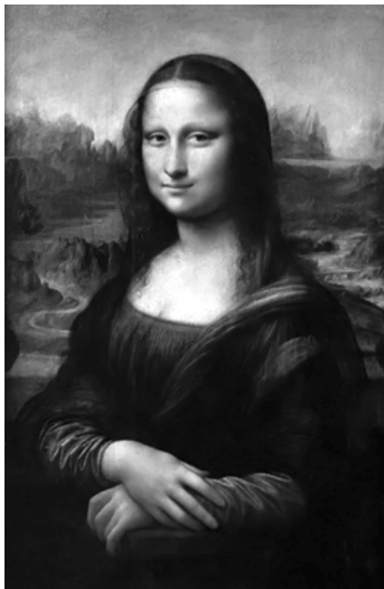
Leonardo da Vinci, Mona Lisa, cerca de 1502. Pintura a óleo sobre madeira. 77cm. x 53 cm.