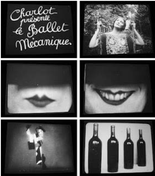
Fernand Léger. Film Ballet Mécanique (Filme Balé Mecânico), 1924.

1 Desde o século XIX, depois da invenção da fotografia, do incremento do jornal, do surgimento do cinema e da 4 explosão da publicidade, passo a passo, a era de Gutenberg foi cedendo seu espaço exclusivo — de alta cultura e de linguagem tão próxima quanto possível da pureza de meios (a escrita) — 7 para linguagens cada vez mais híbridas, das quais o cinema e, então, a televisão são exemplos. Durante mais de três quartos do século XX, de um lado, o texto escrito mantinha-se como 10 detentor dos valores da ciência, do conhecimento e do saber, enquanto, de outro lado, os meios de informação e entretenimento, marcados pela explosão do som e da imagem, 13 tomavam crescentemente conta da paisagem cultural. Entre ambos, a arte mantinha sua sabedoria sobre o reino da sensibilidade. O advento da web e da linguagem que nela 16 circula, a hipermídia, trouxe, entretanto, intensas transformações nessa distribuição de papéis e funções culturais. Tudo começou a misturar-se.