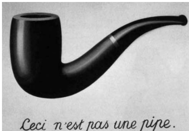
René Magritte. Ceci n'est pas une pipe , 1929. Internet: <museumexhibitions.wordpress.com>.

1 Para o filósofo Vilém Flusser, a relação texto-imagem assumiu, na Idade Média, a forma de disputa entre o cristianismo textual e o paganismo imagético. Na Idade 4 Moderna, houve conflitos entre a ciência textual e as ideologias imagéticas, que, de modo dialético, foram-se criticando. Na tentativa de exterminar o paganismo, o cristianismo acabou 7 absorvendo as imagens pagãs e, na medida em que a ciência criticava esses valores, incorporava as imagens e se ideologizava. Assim, os textos passaram a explicar as imagens, 10 e elas, por sua vez, passaram a ilustrar os textos. Essa troca foi-se tornando tão dialética entre a imaginação e a conceituação, que, num momento, se negavam e, num outro, se 13 reforçavam.