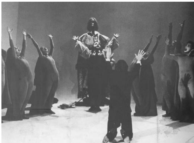
Foto de encenação da peça Roda Viva , de Chico Buarque de Holanda, com direção de José Celso Martínez Corrêa, Rio de Janeiro, 1968.

A cultura brasileira de 1964 a 1968, ano da promulgação do Ato Institucional n.º 5 (AI 5) e da ascensão dos militares da linha dura, não cessou de se afirmar e de produzir indelével frutos. Entre as artes, foi justamente o teatro que se tornou alvo da repressão mais violenta. Talvez por ser uma arte da presença, talvez por estarem os artistas mais radicalmente vinculados às propostas e às organizações de esquerda, a verdade é que os palcos se tornaram espaço de debate onde se discutia, de forma apaixonada, o momento histórico brasileiro. Em 1964, respondendo ao Golpe Militar, estreava, no Rio de Janeiro, o show Opinião.