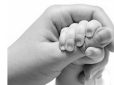
Reflexo de preensão palmar

Assinale a alternativa que identifica corretamente os episódios que ilustram fatos sociais , segundo a definição durkheimiana.