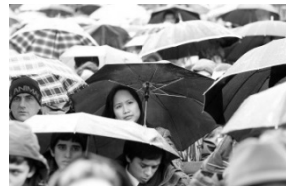
Guarda-chuvas abertos em dia chuvoso