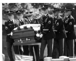
Cermônia militar fúnebre