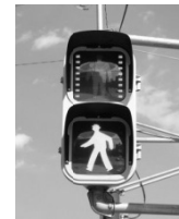
Código de trânsito