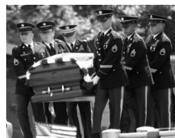
Cermônia militar fúnebre