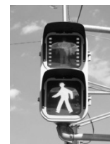
Código de trânsito