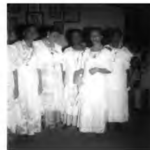
Pierre Verger. Casa de Nagô: Dançantes com Voduns (1948).

Com relação ao Tambor de Mina, com base em seus conhecimentos e nas imagens apresentadas, analise as afirmativas a seguir.