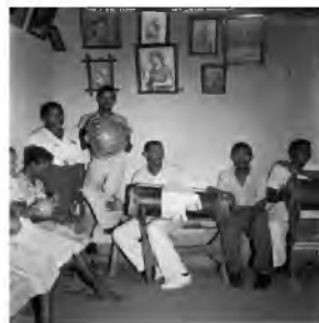
Pierre Verger. Casa de Nagô: Conjunto de músicos com instrumentos característicos (1948).

Pierre Verger foi um fotógrafo e etnógrafo francês radicado na Bahia. Em 1948, em viagem pelo Maranhão, fotografou de perto algumas cerimônias religiosas, como as do Tambor de Mina , reproduzidas a seguir.