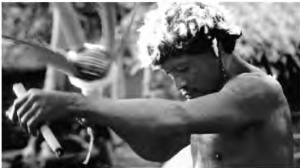
(Eduardo Viveiros de Castro, O pajé Kañi-paye com o aray [chocalho] e o charuto (1982))

As tradições religiosas indígenas são diferentes entre si, mantendo, como um dos traços comuns, a presença do pajé e dos rituais de pajelança.