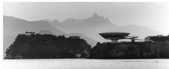
(Painel fotográfico - Museu de Arte Contemporânea (MAC) de Niterói (RJ), projeto de Oscar Niemeyer - Pavilhão do Brasil.

http://www.archdaily.com.br/br/601258/pavilhao-do-brasil-na-bienal-de-veneza-2014-brasil-modernismo-como-tradicao