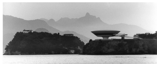
(Painel fotográfico - Museu de Arte Contemporânea (MAC) de Niterói (RJ), projeto de Oscar Niemeyer - Pavilhão do Brasil.

http://www.archdaily.com.br/br/601258/pavilhao-do-brasil-na-bienal-de-veneza-2014-brasil-modernismo-como-tradicao