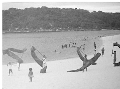
Baldomiro, Arte na Lagoa do Abaeté (Salvador/Bahia, 2000).

Com base na definição acima, assinale a opção que indica corretamente a(s) imagem(ns) que corresponde(m) a exemplo(s) de “intervenção”.