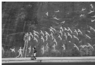
Bel Borba, Mosaicos , Avenida do Contorno (Salvador/Bahia, 1998).