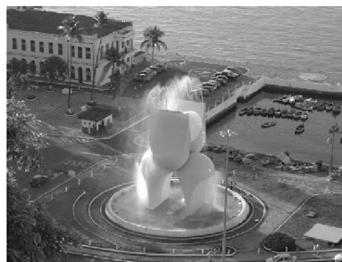
Mario Cravo Júnior, Fonte da Rampa do Mercado (Salvador/Bahia, 1970).