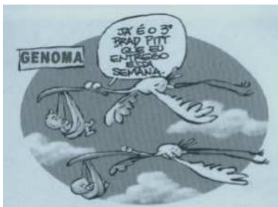
Dalcio, 13 jun. 2000

3. Reunindo elementos verbais e visuais, entendemos que o autor da charge tem a intenção de