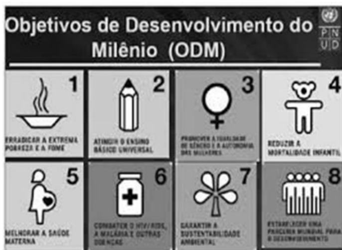
Figura: Objetivos de Desenvolvimento do Milênio.