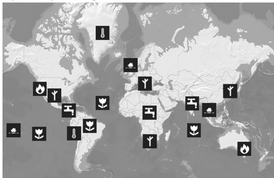
Impacto do aquecimento global no mundo

Analise a figura para responder às questões 34 e 35.