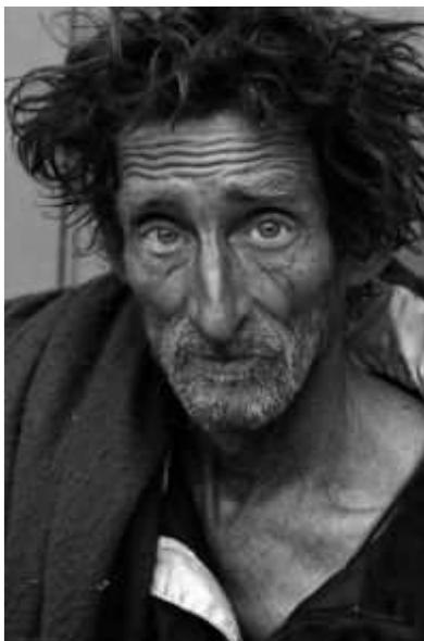
A pobreza é um problema que afeta a maioria dos países

A desigualdade social e a pobreza são problemas sociais que afetam a maioria dos países na atualidade. A pobreza existe em todos os países, pobres ou ricos, mas a desigualdade social é um fenômeno que ocorre principalmente em países não desenvolvidos.