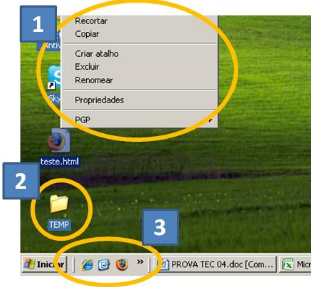
Figura 2 – Canto inferior esquerdo de uma típica área de trabalho Windows.

A questão 31 se baseia na Figura 2, que mostra o canto inferior esquerdo de uma típica área de trabalho do Windows. Nela, alguns elementos são indicados por círculos, numerados de 1 a 3.