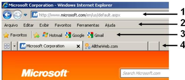
Figura 3 - Canto superior esquerdo do Internet Explorer 8.

A questão 37 se baseia na Figura 3, que mostra o canto superior esquerdo do Internet Explorer 8, bem como setas numeradas de 1 a 4, apontando para quatro de seus elementos.