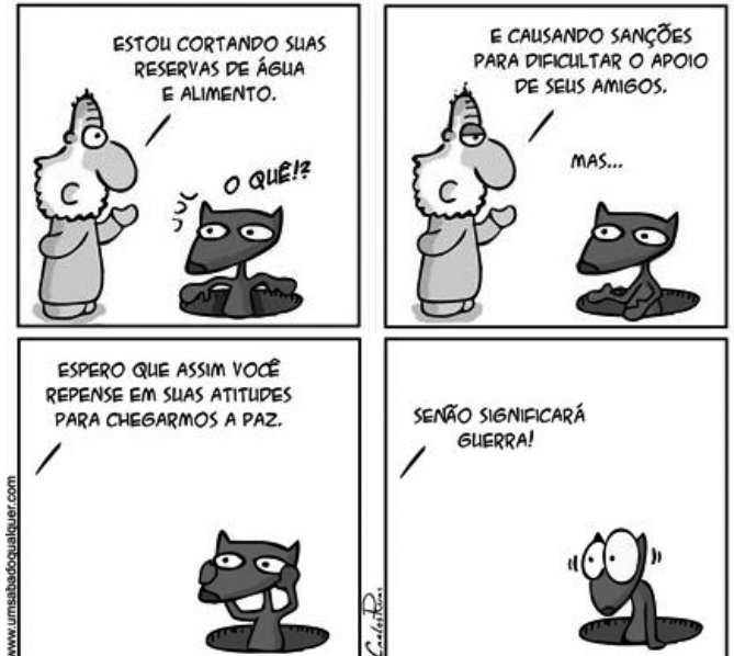
Disponível em: http://www.umsabadoqualquer.com/380-como-nao-chegar-a-paz-2/

03. Com base na leitura do cartum acima, podemos afirmar que o objetivo do autor é: