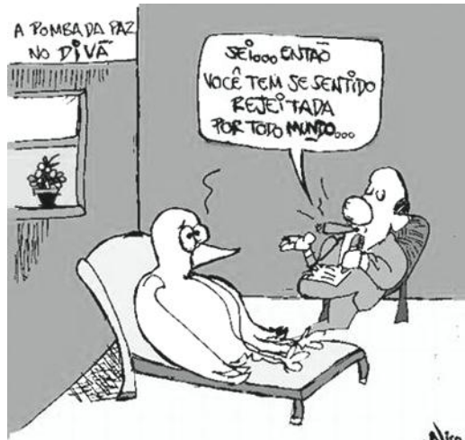
Disponível em: http://brasil.indymedia.org/images/2004/10/293457.gif

01. Com relação ao Texto 01, são corretas as afirmações: