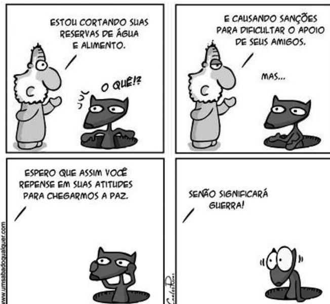
Disponível em: http://www.umsabadoqualquer.com/380-como-nao-chegar-a-paz-2/

03. Com base na leitura do cartum acima, podemos afirmar que o objetivo do autor é: