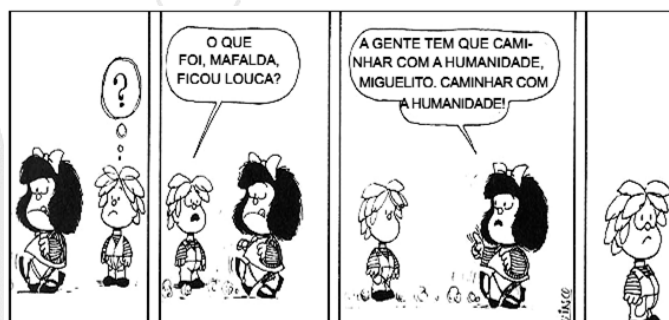
QUINO. Toda Mafalda. São Paulo: Martins Fontes, 2000. p. 95.

06. Considere a charge abaixo e assinale a alternativa correta.