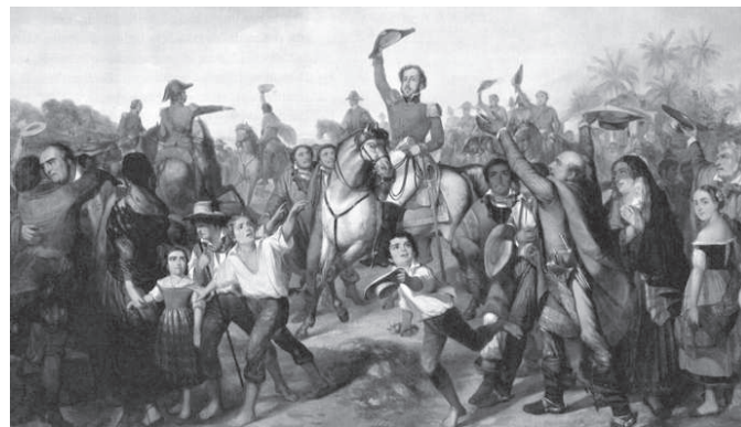
(A proclamação da Independência. Óleo sobre tela de François Moreaux, 1844)

Qual das alternativas abaixo melhor representa a imagem?