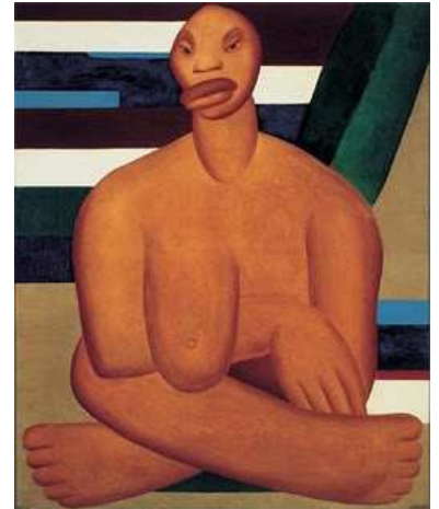
A Negra-óleo sobre tela, 1923

23 - Na obra abaixo ( A Negra -óleo sobre tela, 1923) a pintora revive a negritude da realidade cotidiana da fazenda, lugar onde a pintora cresceu, estabelecendo um diálogo entre a natureza brasileira e a poética construtiva européia. Assinale a alternativa que corresponde a esta artista brasileira: