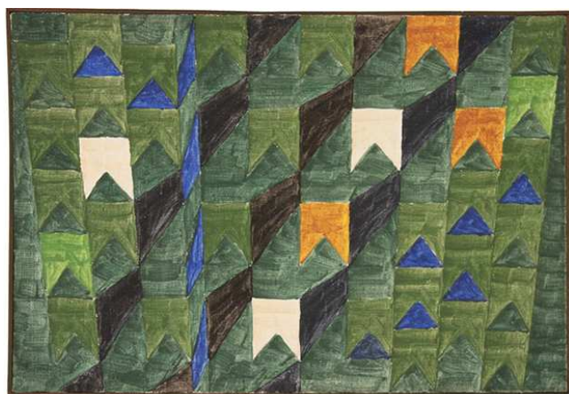
Bandeirinhas com mastros (têmpera sobre tela, década de 1960)

27 - O Brasil tem uma enorme variedade de danças. Assinale abaixo a alternativa que corresponde a dança cujo nome provém dos sons que os sapatos faziam no chão ao se dançar e que é bailada somente por homens, tendo tornado-se popular pelos cangaceiros do bando de Lampião.