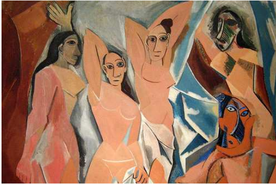
Les Demoiselles d'Avignon de Pablo Picasso

20 - Instalação é o nome que se dá à disposição de objetos-ideias inusitados em determinado ambiente, explorando os sentidos (odor, tato, visão) e permitindo várias leituras. O espectador, ao penetrar nesse espaço, acrescenta suas impressões, ampliando a percepção. No Brasil, é um dos artistas mais conhecidos por suas instalações é: