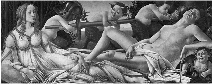
Botticelli, Vênus e Marte (c. 1509).