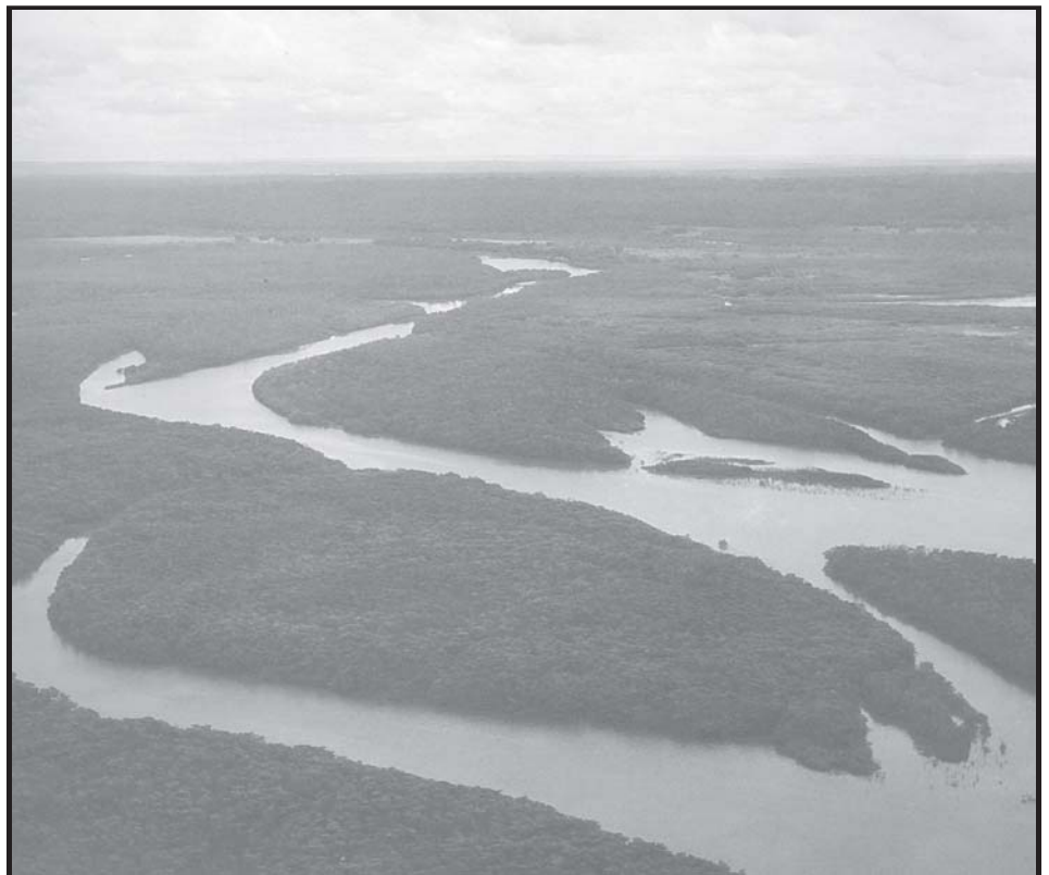
Foto: Wolf Heckendorff. IN: Atlas Geográfico do Estado da Paraíba. João Pessoa: Grafset, 1985.