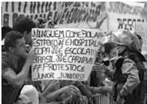
(Manifestação em Fortaleza em Junho de 2013)

Durante a realização da Copa das Confederações (junho de 2013), a imprensa nacional e internacional registrou inúmeras imagens de protestos ocorridos nas principais cidades brasileiras.