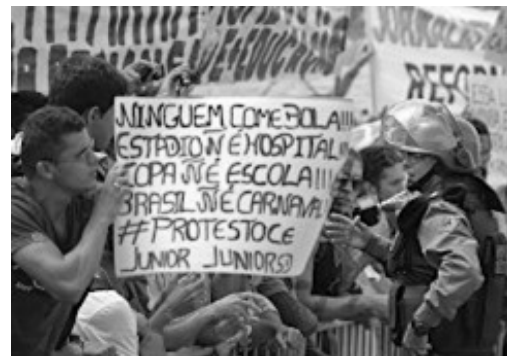
(Manifestação em Fortaleza em Junho de 2013)

Durante a realização da Copa das Confederações (junho de 2013), a imprensa nacional e internacional registrou inúmeras imagens de protestos ocorridos nas principais cidades brasileiras.