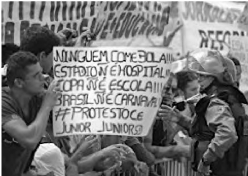
(Manifestação em Fortaleza em Junho de 2013)

Durante a realização da Copa das Confederações (junho de 2013), a imprensa nacional e internacional registrou inúmeras imagens de protestos ocorridos nas principais cidades brasileiras.