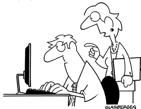
"It's an ergonomic keyboard. If your typing slows down, it automatically injects coffee into your fingertips."