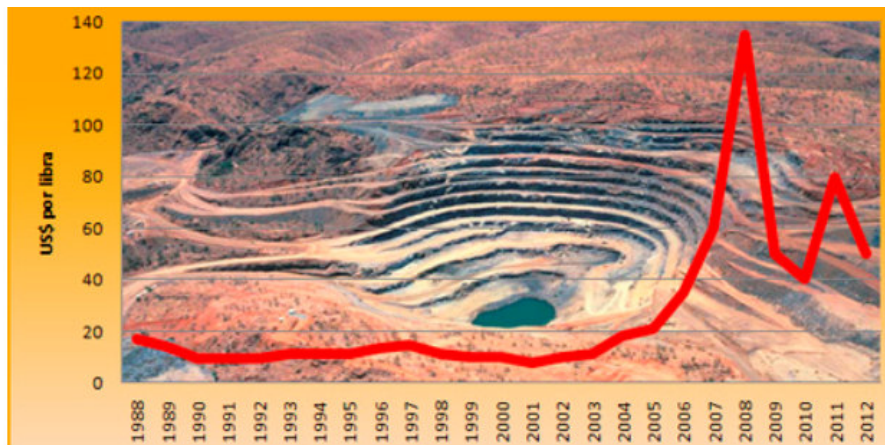
Evolution of Uranium Prices