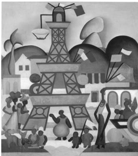
Tarsila do Amaral. Carnaval em Madureira , 1924, óleo sobre tela, 76 cm x 63 cm, Fundação José e Paulina Nemirovsky, São Paulo, SP.