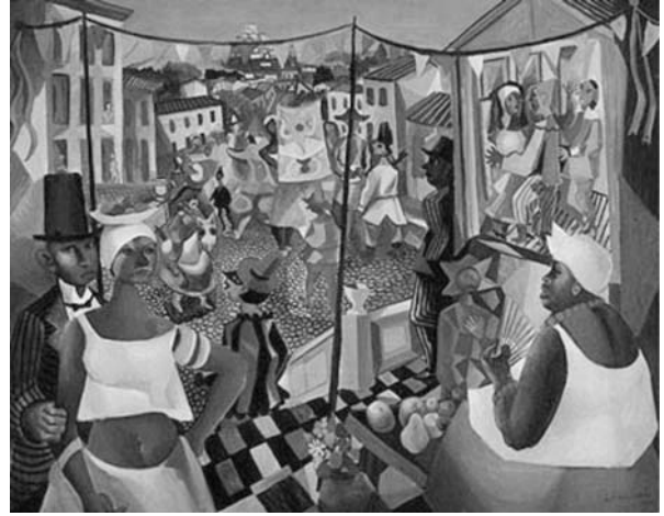
Di Cavalcanti. Carnaval II , 1965, óleo sobre tela, 114 cm x 146 cm.