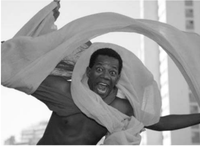
Hélio Oiticica. Parangolé . Capas de vestir que envolvem passista de uma escola de samba em dança improvisada em espaço com formas expressivas.